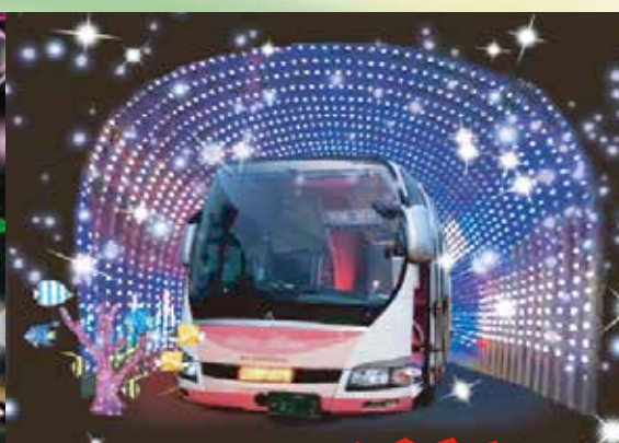
掲載画像はイメージです。

共同主催 / 一般社団法人 日本イルミネーション協会、堺市立サッカー・ナショナルトレーニングセンター 指定管理者 ジェイズパークグループ 072-222-0123